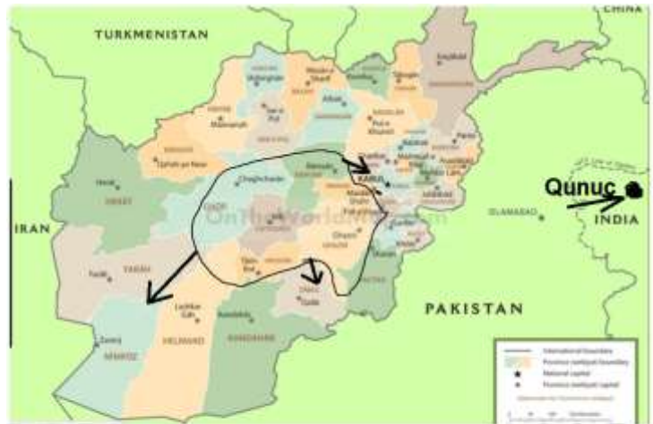
سلطان محمودون حكومتى نېن اوللرى و فردوسى نېن ايرانى

قنوجدان ايران سرحدېنه - ائله جه ده سَقلابا تا چېنه 14 .